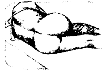
Posición sugerida para examen anorrectal